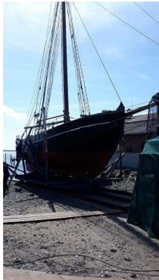
På bedding i 2018