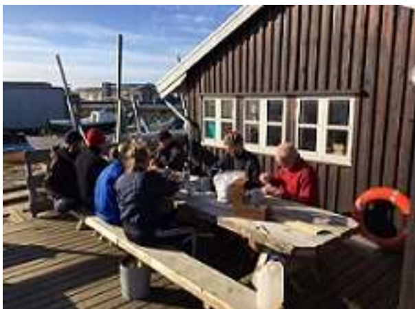
Weekendholdet gør klar...

Den hele startede for et par måneder siden.