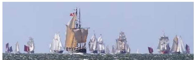
Billede fra Limfjorden Rundt 2019 – det rykker....